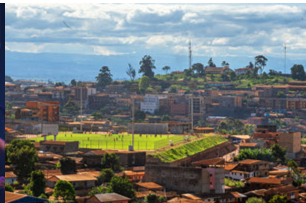
Découvrir le Cameroun autrement Mardi 24 février | 19 h