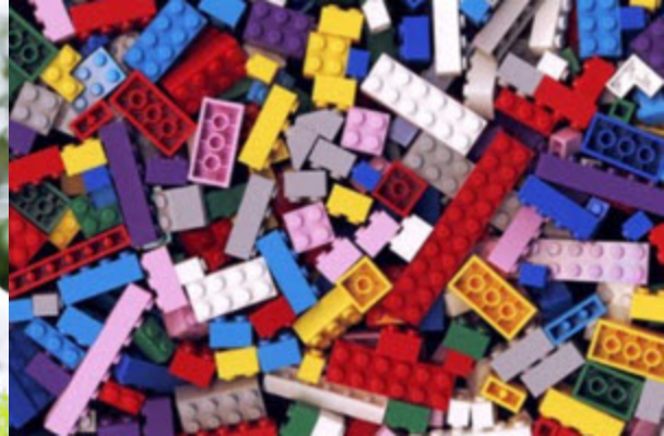
Journée pédagogique – Atelier Lego® Jeudi 12 février | 10 h