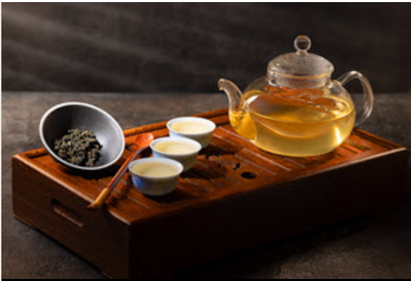
Chá Sān – Trois thés : la culture et le goût du thé chinois Mardi 17 février | 19 h