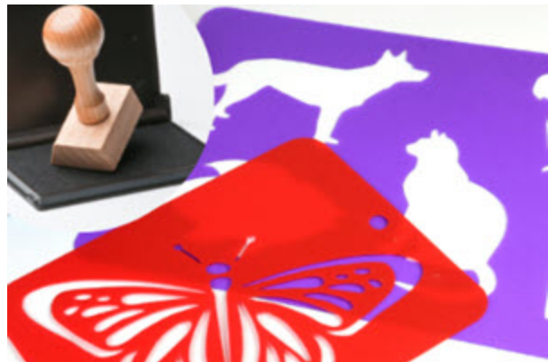
Journée pédagogique – Étampes et pochoirs Vendredi 13 février | 10 h