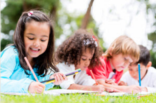
Atelier dessine ta bibliothèque du futur Samedi 7 février | 10 h 15