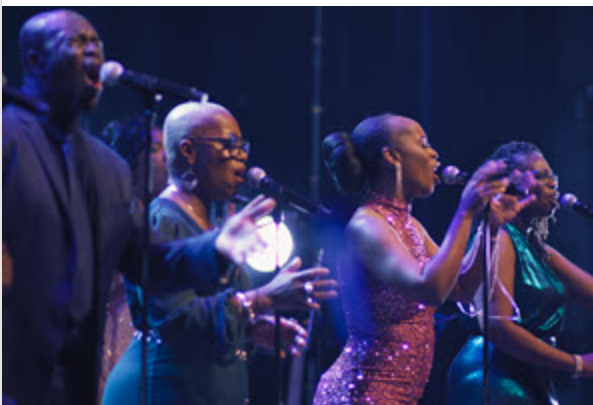
Cinéclub ONF : Une famille de chœur Lundi 16 février | 19 h