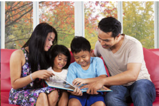
Heure du conte en mandarin Dimanche 15 février | 10 h 30