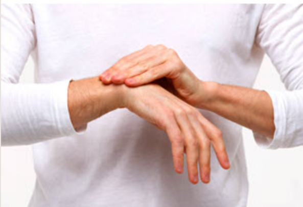
Causons d'arthrite Lundi 2 février | 13 h 30