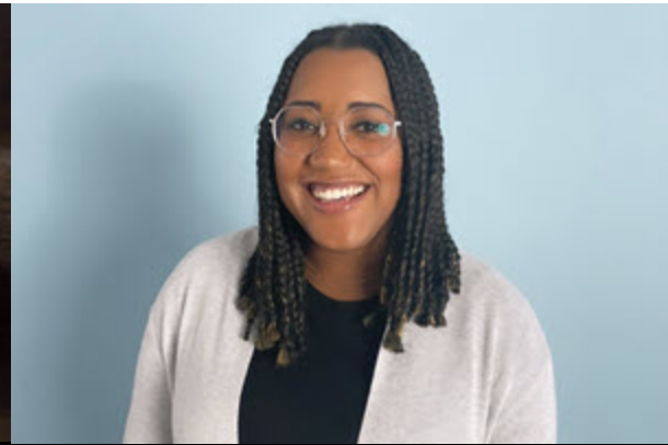
Nourishing traditions : honouring black culinary traditions Mercredi 11 février | 19 h