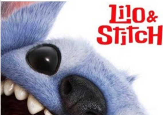
Journée pédagogique – Film Lilo & Stitch Jeudi 12 février | 14 h